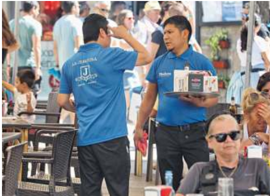
La hostelería es uno de los motores del empleo en Santiago.

Esa misma tendencia de ligero incremento del paro es la pauta en la gran mayoría de los concellos y solo nueve de los 25 que abarcan el área de Compostela han visto reducido su número de desempleados en agosto. Entre ellos, dos cabeceras de comarca como Ordes y Santa Comba, que el pasado mes cerraron con nueve y siete parados menos, respectivamente. Los otros siete municipios en los que no subió