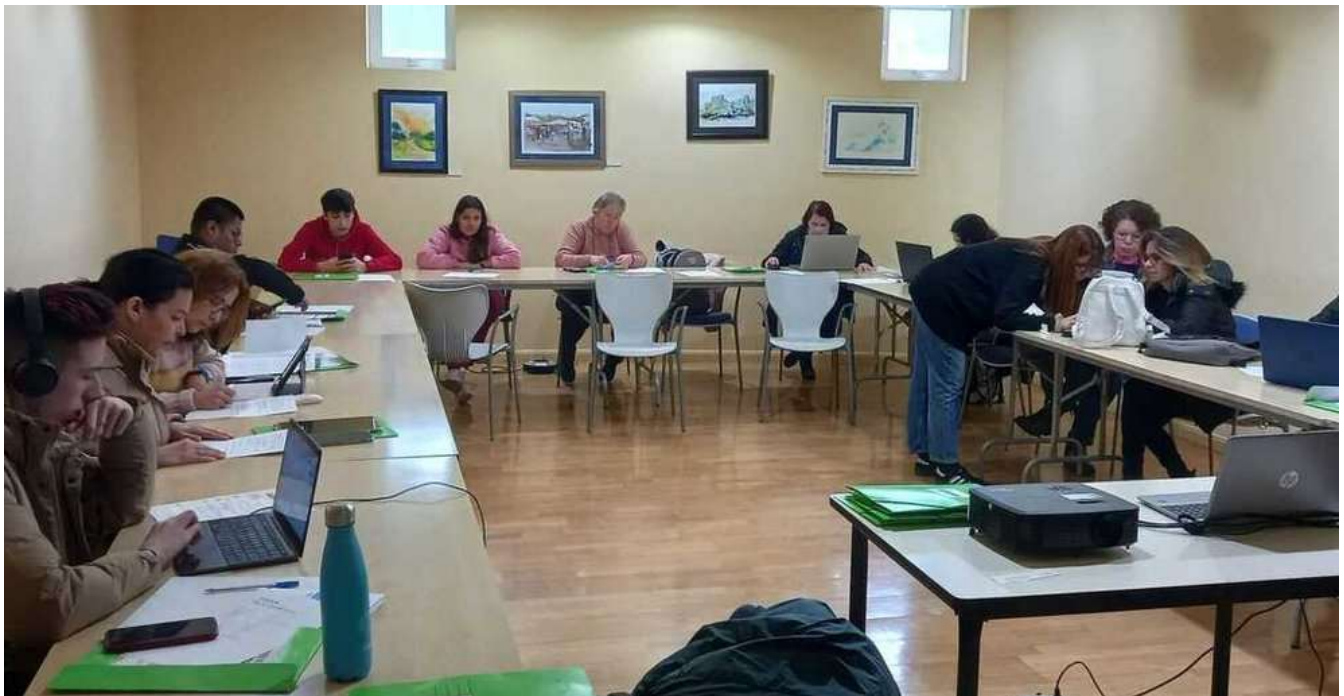
📷 Participantes no Programa Integrado de Emprego 2022/2023 da Asociación Área Empresarial do Tambre.

Os datos a finais de agosto mostran que actualmente están traballando un 60% do cento de persoas participantes no Programa Integrado de Emprego 2022/2023 da Asociación Área Empresarial do Tambre, sendo un 48% as persoas que cumpren, a día de hoxe, cos requisitos esixidos na orde da convocatoria, considerándose insercións efectivas, e superando o compromiso de contratación coa Xunta do 45%.